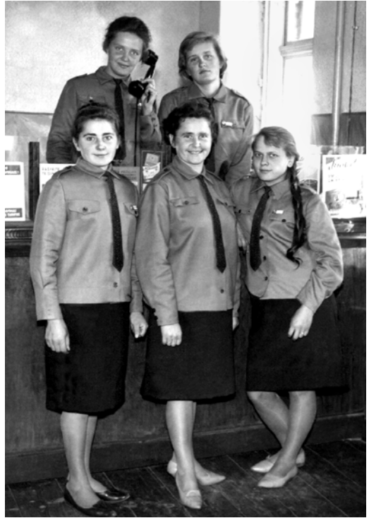
Raguvos pašto darbuotojos senajame pašte. Apie 1965 m.

Įvairiu laiku Raguvos paštui priklausė net 5 pašto agentūros: Vadoklių, Traupio, Raguvėlės, Raguvėlės geležinkelio stoties ir Šilų.