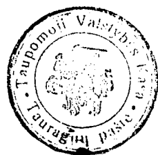
Taupomosios valstybės kasos Tauragnų pašte antspaudas

Jau 1921 m. Tauragnų pašto agentūroje buvo įvestas telefonas 12 . Įsteigus Tauragnuose pašta, abonentų tinklas beveik nesiplėtė. Tada telefono ryšys dar buvo prabanga. Iš leidžiamų kasmetinių Lietuvos telefono abonentų sąrašų galima įsitikinti, kad 1931 m. Tauragnų paštas