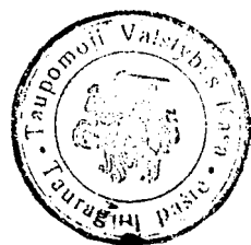
Taupomosios valstybės kasos Tauragnų pašte antspaudas

Jau 1921 m. Tauragnų pašto agentūroje buvo įvestas telefonas 12 . Įsteigus Tauragnuose pašta, abonentų tinklas beveik nesiplėtė. Tada telefono ryšys dar buvo prabanga. Iš leidžiamų kasmetinių Lietuvos telefono abonentų sąrašų galima įsitikinti, kad 1931 m. Tauragnų paštas